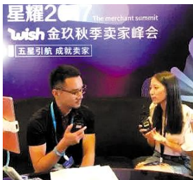
Wish金秋秋季卖家峰会

临近毕业,吴桂花有很多话想借此机会对浙外说:“忆往昔,有过泪水,有过欢声笑语,浙外见证了我的成长,从当初的稚嫩到现在的独当一面,感恩浙外让我有幸加入Wish星青年这个大家庭,圆了自己的创业梦,并变得更加自信、坚强。时间稍纵即逝,希望学弟学妹们善于把握生活中的每个机会,毕业后回想大学四年的生活,脸上浮现的是笑容而不是遗憾。”(记者 姜文丽 沈咏云)